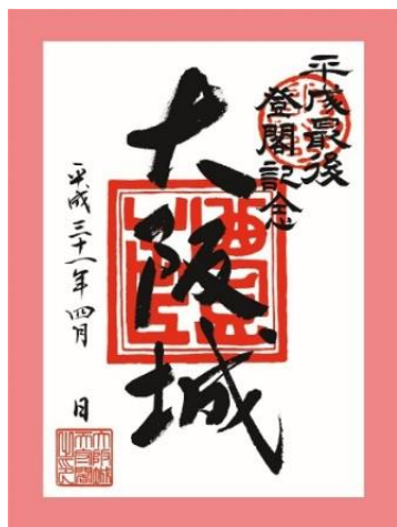
平成最後の入館記念 大阪城天守閣「登閣符」

さらに、GW期間限定で、お子さまはミライザ内にある「イリュージョンミュージアム ～幻影博物館～」と、夜の大阪城公園を歩く「サクヤルミナ」に無料でご入場いただけます。（イリュージョンは11歳以下、サクヤルミナは4歳～12歳）