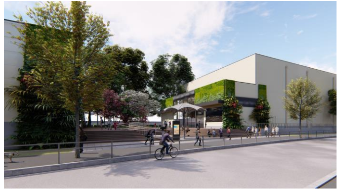
左：劇場A / 右：劇場Bエントランス