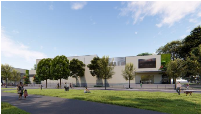
劇場B・C外観 / 右：劇場Cエントランス