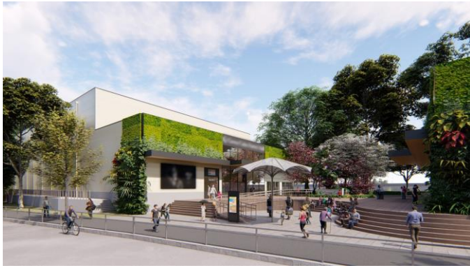
左：劇場A エントランス／中央：多目的スペース